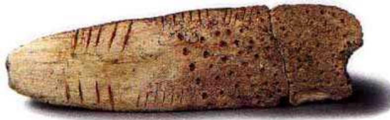
Bois de renne entaillé datant du Paléolithique (15 000 ans av. J.-C.)

Les plus anciennes traces connues de comptage sont liées à la sédentarisation de groupes humains au Proche-Orient (en Mésopotamie), celui des Sumériens, entre 10 000 et 11 000 ans avant Jésus-Christ, à l'apparition de l'élevage d'ovins et à leur vente sur les premiers marchés. Ainsi ont été découvertes des boules de glaise enfermant six petits cailloux (d'où le mot latin calculus ), puis des boules de glaise sur lesquelles six traits figuraient le nombre 6, puis des boules identiques montrant un signe cunéiforme signifiant le nombre 6. La situation de ces boulettes semble montrer qu'elles étaient destinées au comptage des moutons.