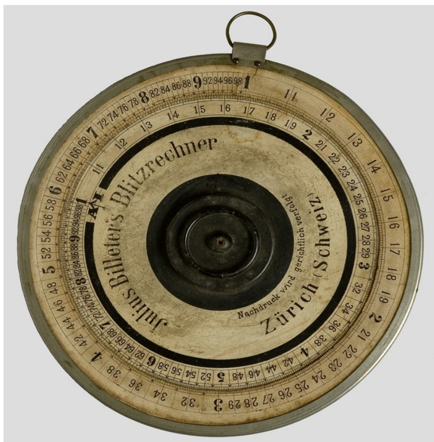
Cercle à calcul Blitz